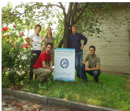
Centro Cochrane Italiano