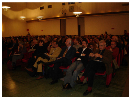
Riunione annuale Roma 28/11/06